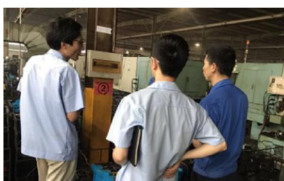
安全隐患交叉检查活动

对存在安全问题整改的有效性及规范性进行“回头看”,针对各工厂的安全隐患进行针对性交叉检查,促进整改效果的巩固和规范。