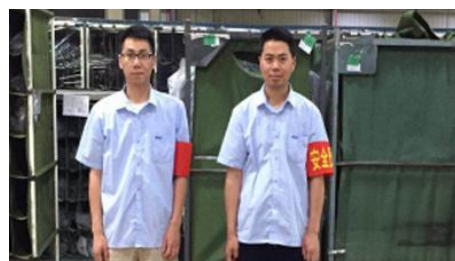
我当一周安全员活动

开展我当一周安全员活动,培养各级安全管理人员及时敏锐的发现安全隐患和解决实际问题的能力,使安全生产意识深深的扎根于每个人心中。