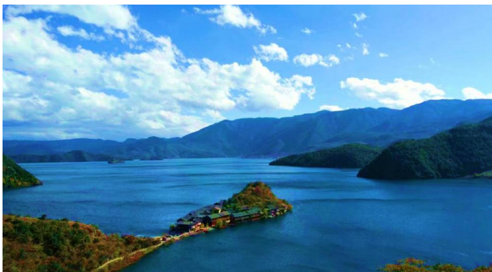
《大美泸沽湖》