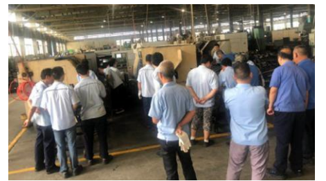
身临其境的安全教育

用情景模拟的方式开展“大家来找茬”安全教育,让员工身临其境地提高安全操作技能和提升安全意识。