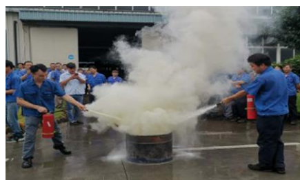
应急预案演练活动

各工厂根据各自的隐患特点,对重要危险领域和潜在的风险隐患,广泛开展现场处置方案和重点岗位应急处置演练活动。