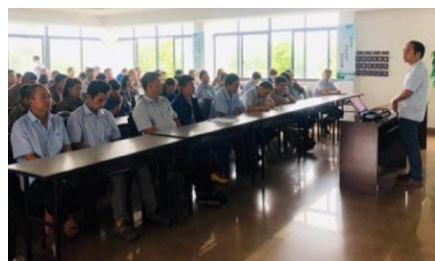
“安全为了谁”座谈会

座谈会上,员工们围绕“安全为了谁”的主题畅谈安全生产的重要性,进一步增强了“我要安全、我会安全、我能安全”的思想意识。