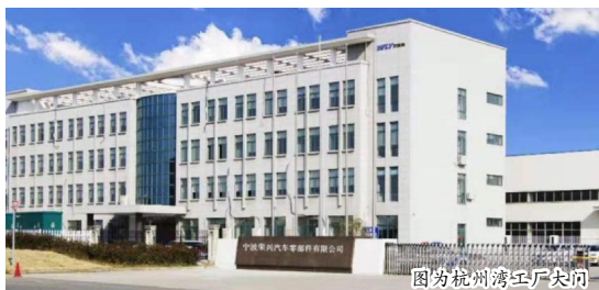
图为杭州湾工厂车间