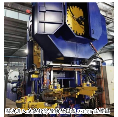
图为进入试运行阶段的德国线2500T热模锻

淡季不淡,旺季更旺。随着传统旺季的到来,锻造分厂作为源头单位,生产压力巨大。在万里扬井冈山精神的鼓舞下,锻造分厂全员树立“一盘棋”思想,各司其职,众志成城,加班加点奋斗在岗位,保质保量完成生产任务;管理团队做好支援工作,哪里需要就去哪里,一切为生产服务。在保障自身生产的同时,还抽调精兵强将支援乘用车生产,组建了包括生产、设备、技术、质量、综合19人次的支援小组,利用加班时间,协助乘用车分厂生产保障的各个环节。同时快马加鞭推进产能建设项目,截至9月,1条630T热模锻和2条1000T热模锻顺利投产,1600T热模锻完成建设;韩国线的日均产量得到较大提升,日产量接近4500件;德国线完成安装调试,进入试运行阶段。