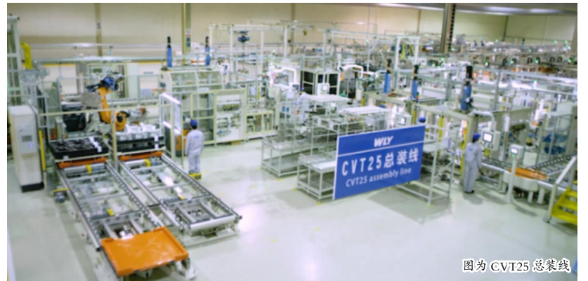
图为 CVT25 总装线

速箱有限公司等,进一步完善了事业版图,在汽车零部件行业里不断提升产品质量,为客户提供优质服务及系统解决方案。 “万里扬”始终以振兴民族工业为己任,已经拥有了十多家全资或控股子公司。生产基地遍布浙江、安徽、辽宁、山东、河北、江西、江苏、贵州和湖南等地,超百亿元总资产,10余个生产基地。累计生产销售变速器超过1000万台,带动500余家上下游配套企业共同发展;国家高新技术企业、国家知识产权优势企业、全国文明城市、中国汽车零部件变速器行业龙头企业、中国优秀民营科技企业;名列中国汽车零部件百强榜前列,荣获中国汽车零部件汽车成长性TOP10榜单前十……这是“万里扬”在23年跨越式发展中留下的一串数字和荣誉,奠定了其行业领跑者的地位,为中国向汽车强国迈进贡献力量。(转载自2019年9月29日《钱江晚报》)