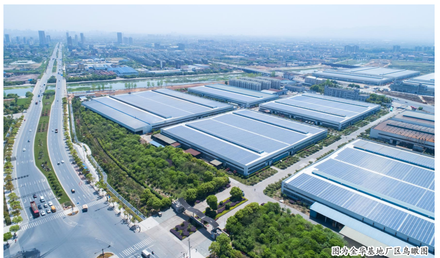
图为金华基地厂区鸟瞰图