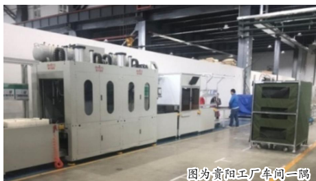
图为贵阳工厂车间一角

自今年2月湘潭工厂顺利投产以来,内饰事业部积极布局,加强制造能力和扩大市场版图,新的两大工厂——杭州湾工厂和贵阳工厂也在如火如荼建设中。