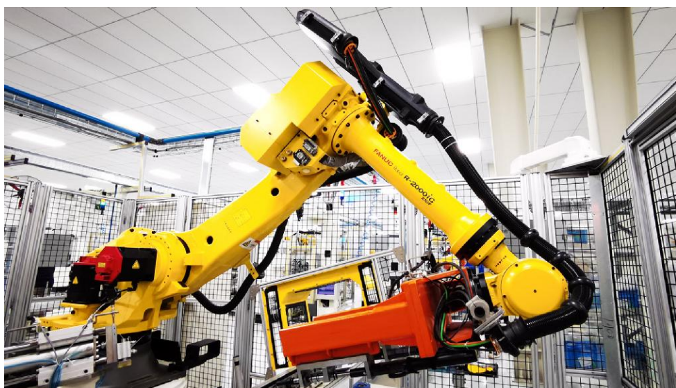
(上接第 1 版)