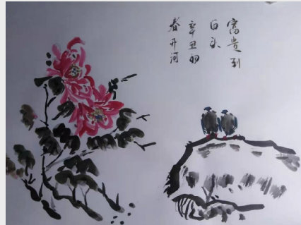
《富贵到白头》 齿轮二工厂 鲁开河