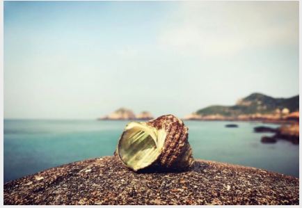
《听海》 企业管理中心 蔡梦婕