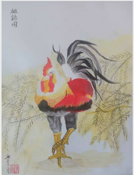
《雄鸡图》 齿轮二工厂 刘荷涛