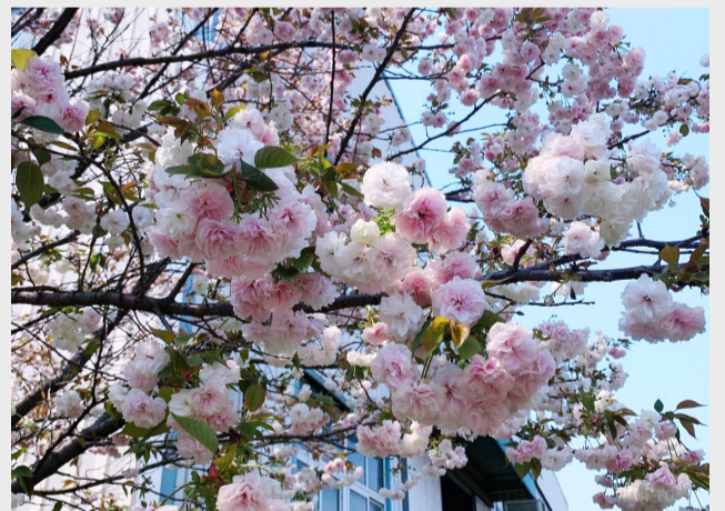
《盛樱绽放》(摄影) 商变重卡变速器工厂 廖单