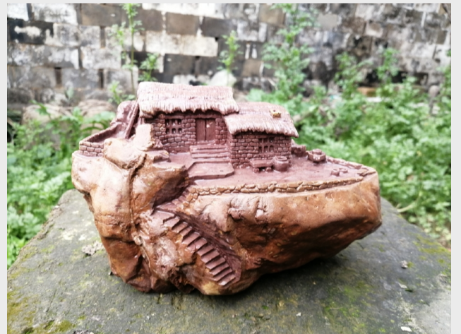
《乡村小院》(石雕) 机械制造公司 伊益仑