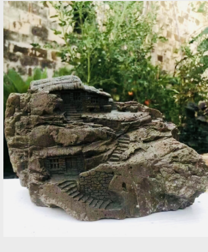
《乡邻》(石雕) 高端铸造公司伊益仑