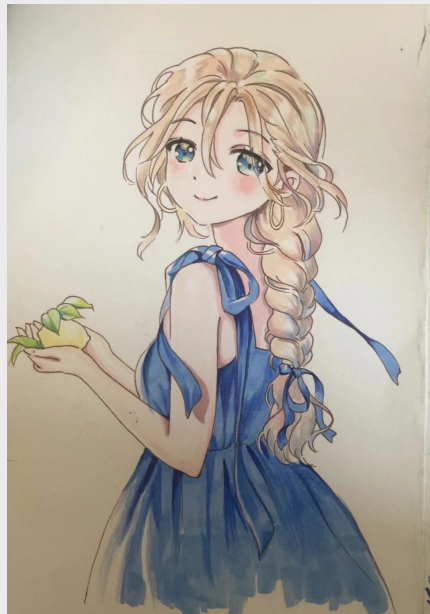
《少女》(绘画) 企业管理中心伊惠娟家属 陆杰伦