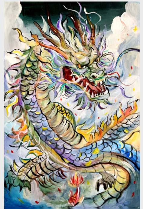
《龙腾云起》(绘画) 商变事业部重卡质量部宋浩男家属 周玲